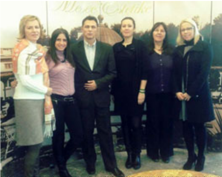
Učesnici projekta "Poveziavnje mladih sa tržišnom privredom" u hotelu "Sava" u Zagrebu, 14.12.2014.