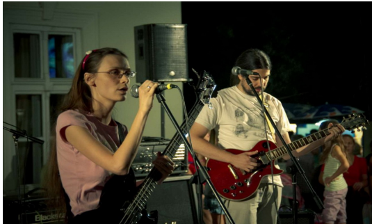
Projekat "VrBa ispod zemlje" – Vrnjačka rok scena od 1965.-2010.

Realizovali su Centar za decu i omladinu Vrnjačka Banja